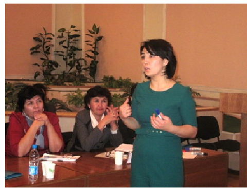
Фотографии 1-2. Представители МВД, «Фонда Махалля», Юрист НПО «Истикболми Авлод» Государственный Реабилитационный Центр, презентация в ходе проведения круглого стола (Круглый стол в рамках программы по Борьбе с Торговлей Людьми)