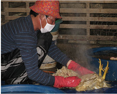
USAID và đối tác giúp nâng cao nhận thức về cúm gia cầm cho nông dân ở Việt Nam